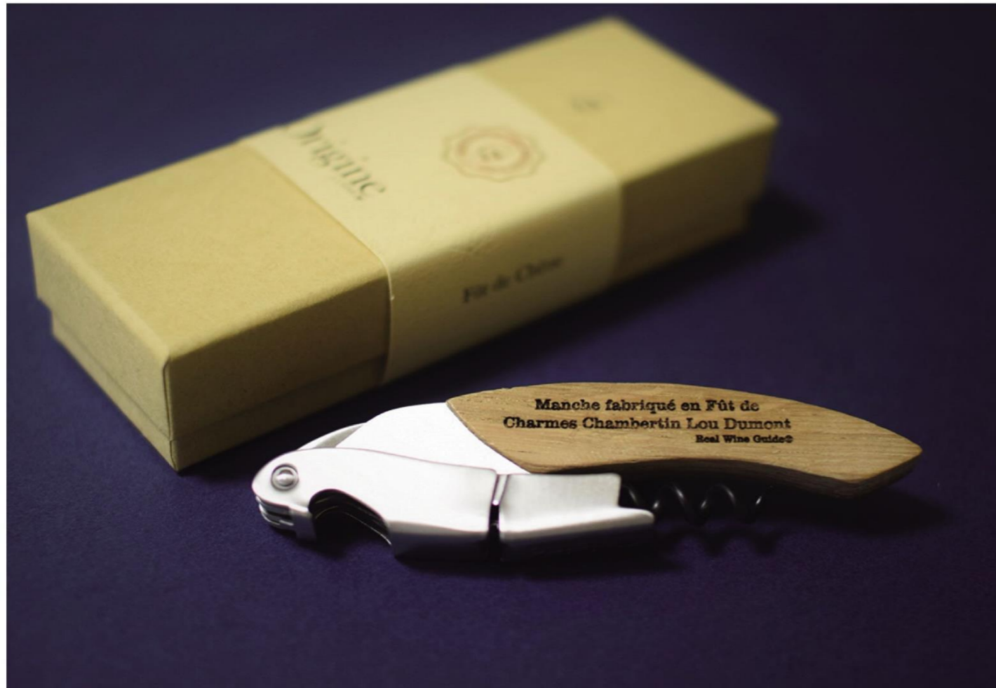
RWG オリジナルコルクオープナー (フランス製) 7,500 円 (税別) 限定 500 個

ブルゴーニュ著名生産者のフラッグシップワイン (※) の樽熟成時に使った樽をそのままオープナーの柄に使用して、フランスの熟練の職人さんがひとつひとつ丁寧に手作りしました。これは世界中でRWGにしか作れない限定希少品です。