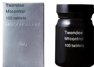
Twendee mt (Tmt100) 100粒入り プラボトル