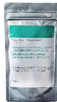
Twendee mt (Tmt200) 200粒入り (詰替用) アルミパッケージ